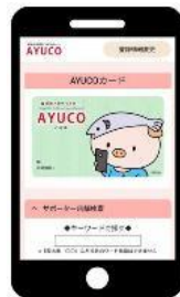
「AYUCO」トップページ (厚木市HPより)