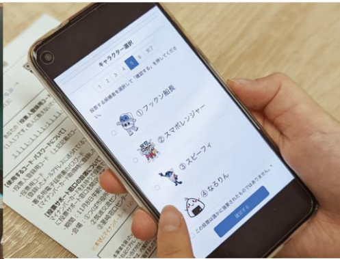
スマートフォンの投票画面から キャラクターを選択する様子