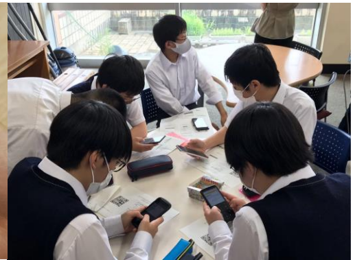
生徒会選挙にてスマホから 投票する高校生