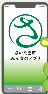
さいたま市PRキャラクター つながる竜

お得意3 お買い物で 決済額の 3%分 ポイントGET 期間:12/1(日)~1/5(日)