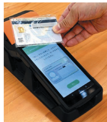
カード用決済端末