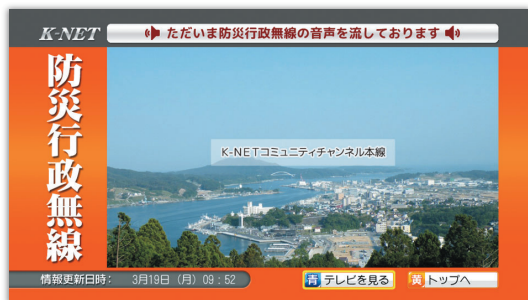
気仙沼ケーブルネットワーク(株)他